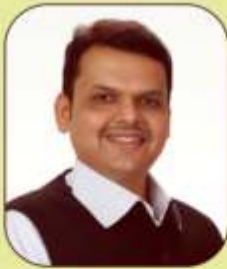
श्री. देवेंद्रजी फडणवीस मा. मुख्यमंत्री