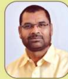
श्री. सदाभाऊ खोत मा. राज्यमंत्री कृषि व फलोत्पादन, पणन