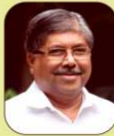
श्री. चंद्रकांत पाटील मा. मंत्री कृषि व फलोत्पादन, पणन, महसूल, मदत व पुनर्वसन, सार्वजनिक बांधकाम